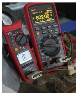
600V ochrana na všech rozsazích