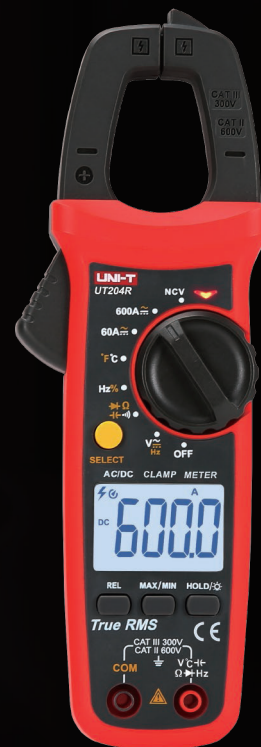
UT203R/204R (AC/DC proud)