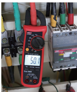
Měření frekvence na vysokých napětích