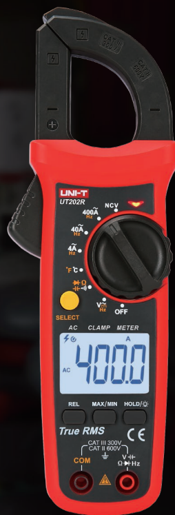
UT201R/202R/202F (AC pouze střídavý proud)